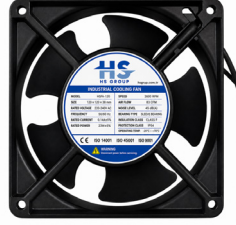
150x150x38 (140m 3 /hr)