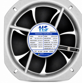
225x225x80 (700m 3 /hr)