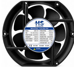
172x150x50 (240m 3 /hr)